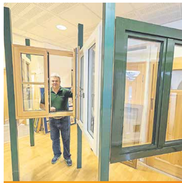
Einbruchhemmende Fenster – und Türentechnik gewinnt leider auch in Bayern immer mehr an Bedeutung. Wieser-Fenster erfüllen hohe Anforderung beim Einbruchschutz und sorgen für ein gutes Sicherheitsgefühl.

des Schreinerhandwerkes an, doch liegt einer seiner besonderen Schwerpunkte im Fensterbau und der Fenstermontage. Schließlich sind moderne Fenster längst keine Standardelemente mehr und müssen in den Bereichen Schallschutz, Energiesparen und Sicherheit hohen Anforderungen gerecht werden. Seine Kunden erhalten Fenster, die nicht nur gut aussehen, sondern auch ein ruhiges, warmes und sicheres Zuhause bieten.