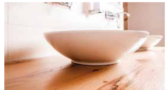
Badmöbel by mittermeier | Eiche

Beratung und Ausstellung: Terminvereinbarung unter 08094 / 561 oder info@schreinerei-mittermeier.de