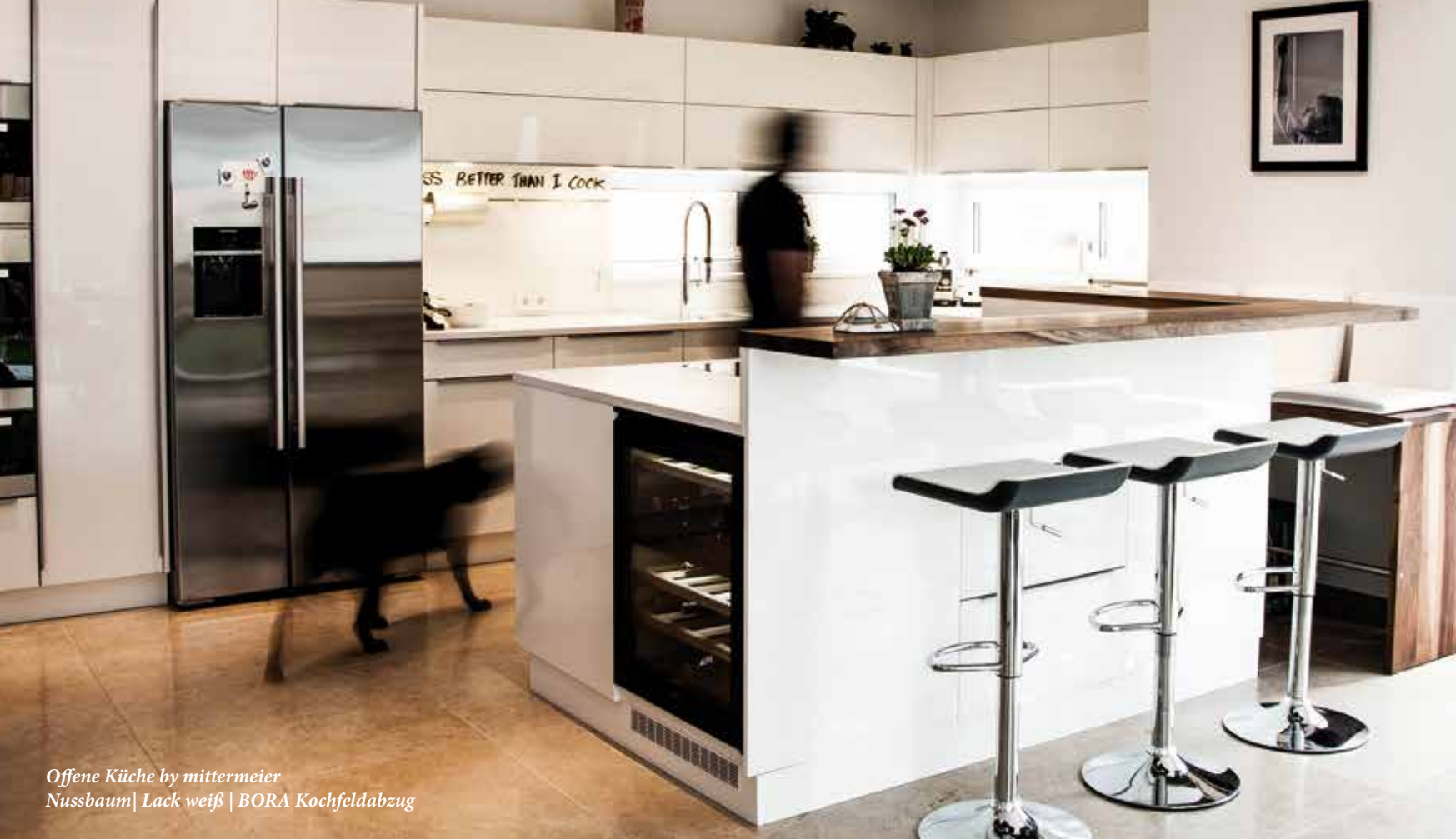
Offene Küche by mittermeier Nussbaum | Lack weiß | BORA Kochfeldabzug

Modernes Handwerk bei mittermeier - Die Möbelschreinerei