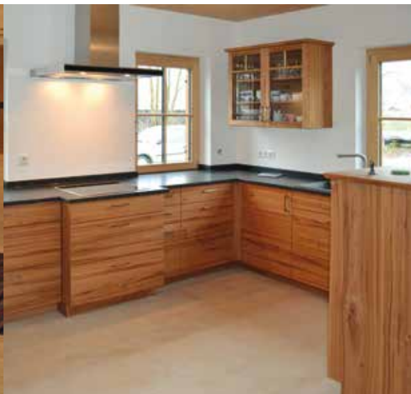
Meist ist die Küche der Lebensmittelpunkt der Familie. Wir planen und bauen sie nach Ihren Bedürfnissen.