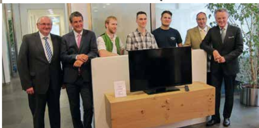
Ausstellungseröffnung „Die gute Form“ in der Raiffeisenbank Zorneding